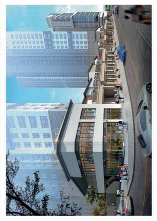
부산 오션스퀘어 동측 방향