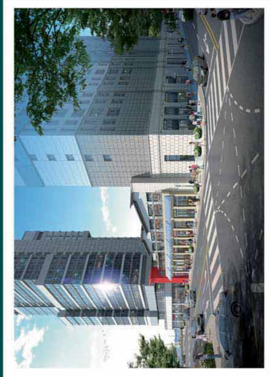
부산 오션스퀘어 남측 방향