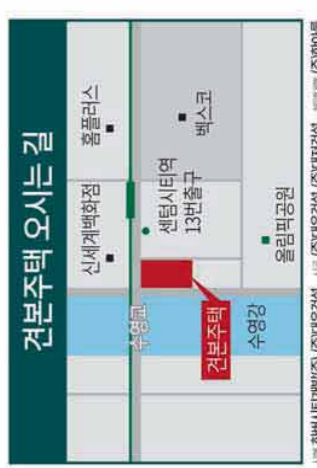
건보주택 오시는 길

■ 상업면, 부산 오션시티 푸르지오 단지내 상업시설 ■ 위치: 부산광역시 영도구 동상동 1189번지 인위(동상)하리 도시개발사업 ■ 건축규모: 지하3층지상49층(공동주택49층, 숙박시설20층, 판매시설2층) ■ 판매시절: 총112호실 ※ 위치 등에 대한 판매내용은 공동주택관리법 시행령 제52조 및 제53조의 규정에 따라 적용됩니다. ※ 본 홍보물에 실린 사진 이미지들은 소위 자아예비물 등기 위임 것으로 실제와 다를 수 있습니다. ※ 본 홍보물에 실린 모든 개별개체는 관계기관 혹은 관계사의 사용에 의해 변경 될 수 있습니다.