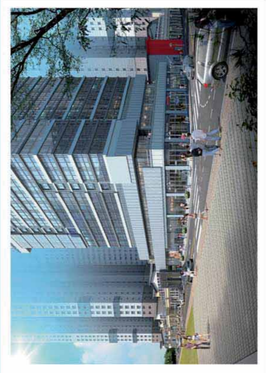
부산 오션스퀘어 북측 방향