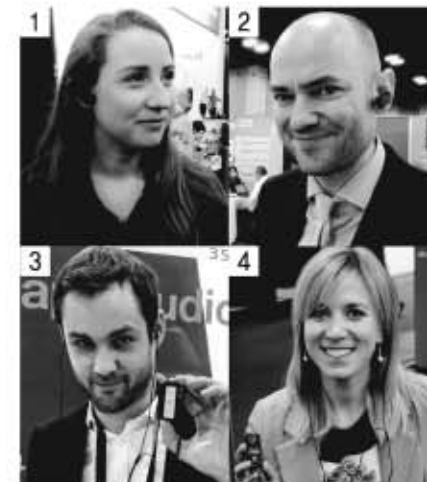
2015, 2016 미국청각박람회에서의 셀프100, 200보청기를 착용해보고 있는 외국 바이어들 ①,② 셀프100보청기 ③,④ 셀프200보청기

A/S센터에서 1년간 무상A/S를 해 주고, 국산 제품이므로 이후에도 편리하게 A/S가 가능한 제품이다. 디지털 보청기는 청력 손실도에 따라 필요한 만큼만 증폭 조절하여 주기 때문에 명료한 음을 들을 수 있고 저음, 고음을 청력에 따라 주파수별로 조정하므로 깨끗한 음을 들을 수 있는 보청기이다.