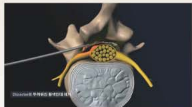
추간공성형술키트 (FORAMOOON™) 시술모형으로 Dissector로 두꺼워진 황색인대를 제거하여 추간공과 척추관의 크기를 늘려줌