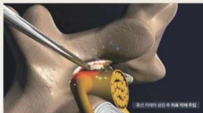
신경유착을 뜯어내고 치료약제를 주입하여 척추신경의 기능을 회복시킴