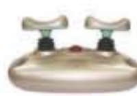
2016년 닥터큐 골드 2세대 출시