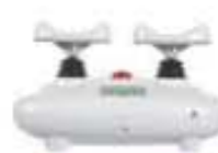
2019년 닥터큐 킹 3세대 출시