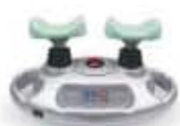
2013년 닥터큐 1세대 국내최초 첫 출시

누적 판매량 20만대, 고객 만족도 90% 대한민국 최초 발목펌프 운동기 닥터큐