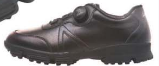
챌린저2 천연소가죽/엠보싱 러버창 AP-21 블랙 / 250-280mm(남성용)