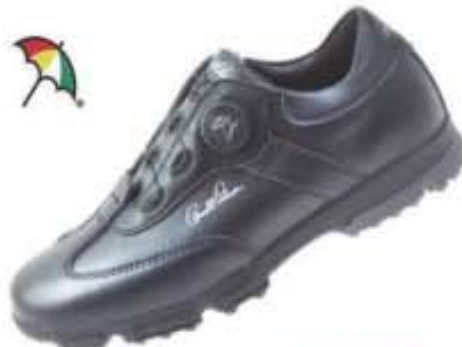
특별할인가: 139,000원 ▶69,500원 챌린저2 천연소가죽/엠보싱 러버창 AP-02 블랙 / 230-280mm(남성용)