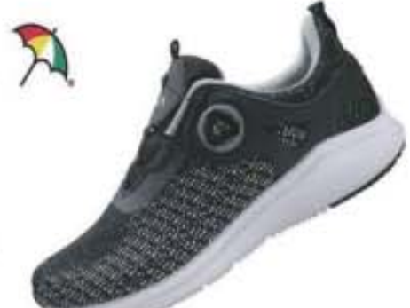
특별할인가: 119,000원 ▶52,500원 라이트 니트+매쉬/파이론창 AP-31 블랙 / 250-280mm(남여공용)