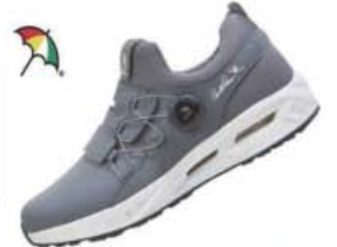
특별할인가: 138,000원 ▶59,500원 슈퍼핏 매쉬+듀스포럼/파이론창(2중 에어백) AP-14 그레이 / 250-280mm(남성용)