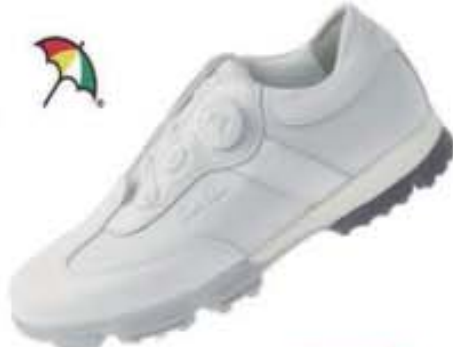
특별할인가: 139,000원 ▶69,500원 챌린저1 천연소가죽/엠보싱 러버창 AP-01 화이트 / 230-280mm(남성용)

아놀드파마 챌린저1.2 원터치 다이얼시스템은 안정되고 편안한 피팅감을 제공하며, 3D블록 스파이크는 우수한 접지력 및 내마모성을 통해 뛰어난 안정감을 제공한다. 일상화 및 기능성 골프화로도 활용될 수 있어 1석4조이다.