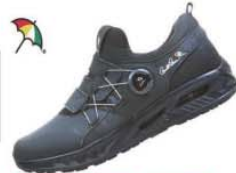
특별할인가: 138,000원 ▶59,500원 슈퍼핏 매쉬+듀스포럼/파이론창(2중 에어백) AP-13 블랙 / 230-250mm(여성용)