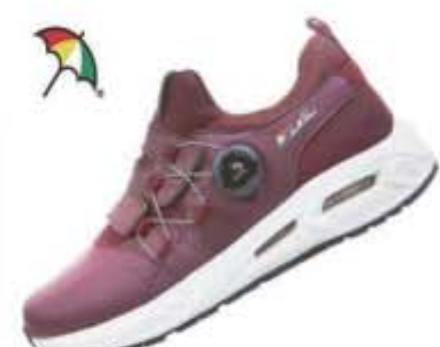
특별할인가: 138,000원 ▶59,500원 슈퍼핏 매쉬+듀스포럼/파이론창(2중 에어백) AP-15 와인 / 230-250mm(여성용)

2020년형 신제품 아놀드파마 슈퍼핏 오토화는 최신형 보아 시스템(원터치 다이얼시스템) 및 2중 AIRBAG (충격흡수) 장착 하였고, 열 가소성 고무 아웃솔로 미끄러움을 잡아주어 안전한 보행이 가능한 국내인 족형에 최적화된 리스트를 적용하여 편안한 착화감으로 장시간 보행시 발의 피로감을 낮춰준다. 2020년 신제품 슈퍼핏 오토화 출시기념으로 50% 파격할인 행사를 실시한다고 한다.