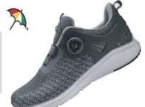
특별할인가: 119,000원 ▶52,500원 라이트 니트+매쉬/파이론창 AP-32 그레이 / 250-280mm(남성용)