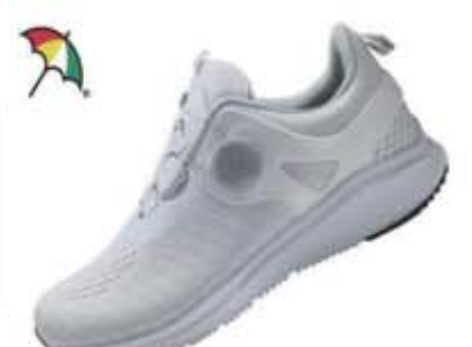
특별할인가: 119,000원 ▶52,500원 라이트 니트+매쉬/파이론창 AP-33 화이트 / 230-250mm(여성용)