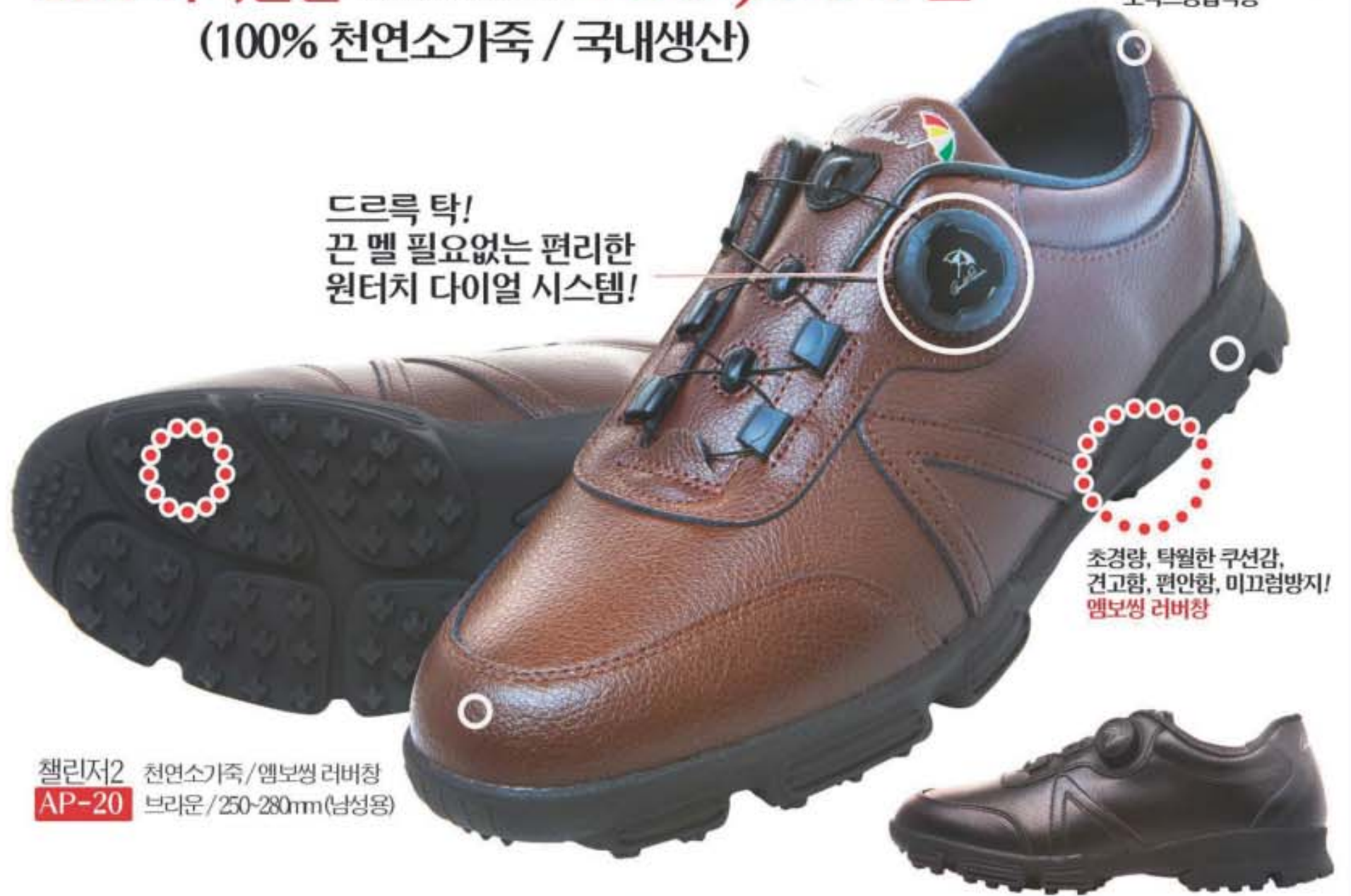
챌린저2 천연소가죽/엠보싱 러버창 AP-20 브라운 / 250-280mm(남성용)