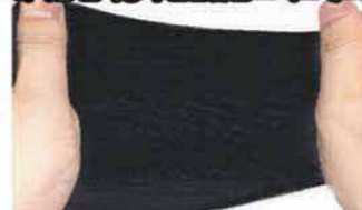
에코벨 향균마스크는 효성스핀텍스를 사용하여 신축성이 뛰어난 남성, 여성 모두 착용이 가능.