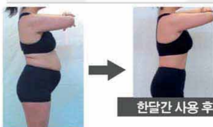
한달간 사용 후

(제품스펙) 420×180×20mm 중량 약128g 충전지 리튬폴리머 재질 실리콘, ABS수지 (사용구성) 본체, 전극패드×6장, 보관용 시트×2장, 충전 케이블, AC어댑터, 취급설명서 (보증서 포함)