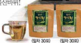
(잎차 30포) (잎차 30포)