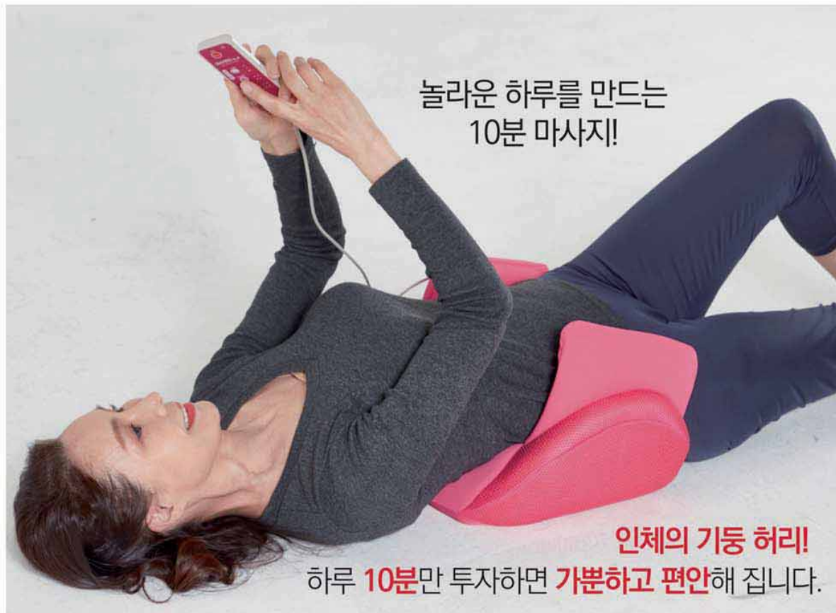
놀라운 하루를 만드는 10분 마사지!