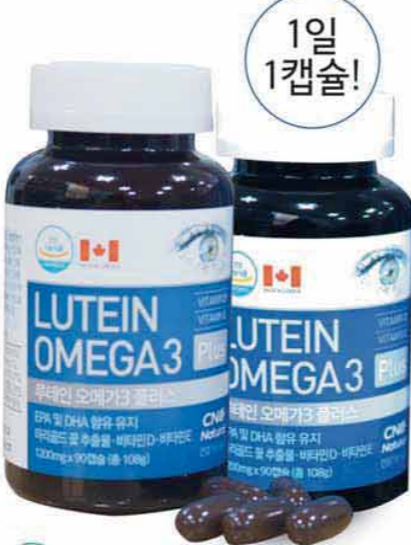
1일 1캡슐! 식약처 품목제조신고 건강기능식품 용량 : 1200mg×90캡슐×2박스(6개월분)

건조하고 침침한 눈을 위한 이상적인 조합 비타민 D와 E, 불포화지방산으로 누구나 꼭 필요하다는 오메가 3, 침침한 눈을 위한 루테인 등 4가지는 현대인들이 살아가면서 섭취해야 하는 필수