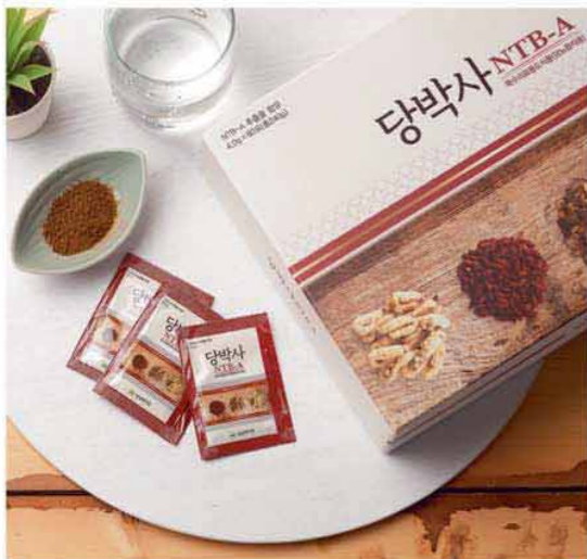
공급원 : 상삼바이오 용량 : 4.0g×60포(총240g) 특수의약품도식품(당뇨환자용)