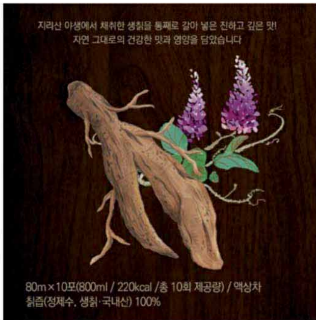
지리산 야생에서 채취한 생취를 통째로 갈아 넣은 진하고 깊은 맛! 자연 그대로의 건강한 맛과 영양을 담았습니다.

지리산 야생에서 채취한 생취를 통째로 갈아 넣은 진하고 깊은맛! 자연 그대로의 건강한 맛과 영양을 담았습니다.