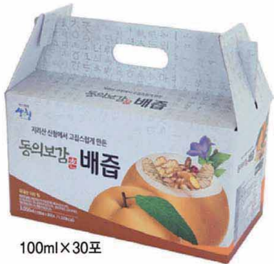
100ml X 30포

경남 산청군 특산물(건강식품)로 가공된 식품으로 산청군에서 인증하고 추천합니다.