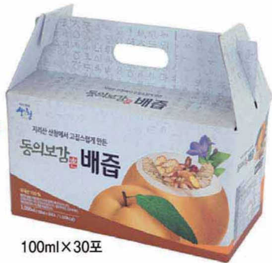
100ml X 30포