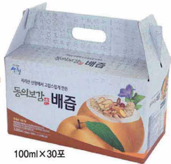
100ml X 30포