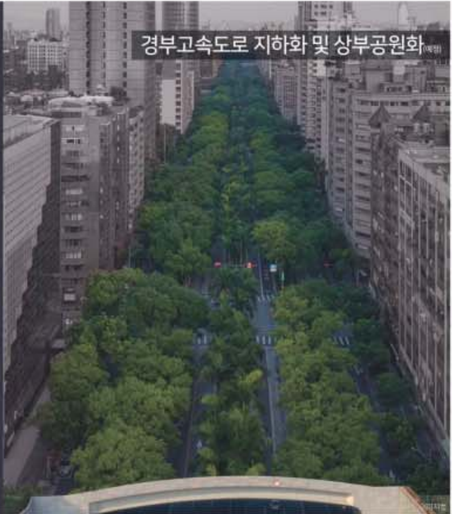
경부고속도로 지하화 및 상부공원화

의 용도를 개발주체와 승인관청이 사전 협상을 통해 결정할 수 있도록 하면서 지지부진하던 개발에 날개를 달 전망이다. 특히 기존 지구단위계획에 포함됐던 최고 200m의 건축 높이를 250m로 높일 수 있게 되면서, 서울의 대표적인 초고층 빌딩인 여의도 63스퀘어(249m)와 비슷한 수준의 랜드마크 빌딩도 들어설 것으로 기대된다. 또한 재정비안에는 서초대로를 중심으로 강남역 사거리와 인접한 부지들이 특별계획구역으로 지정됐다. 이들 부지의 협상이 원활하게 진행된다면 일대는 삼성타운을 포함해 약 8만 6천㎡ 규모의 대규모 복합 타운이자 첨단 산업의 중심지로 자리매김할 예정이다. 뿐만 아니라 일대 주민들의 숙원사업인 경부고속도로 지하화 사업도 본격적인 추진을 준비하고 있다. 지난해 11월 서초구가 공동 주최해 진행된 포럼에서 조은희 서초구청장은 주요 도로망의 지하화를 통해 단절된 도시공간을 연결하고 교통문제는 물론, 상부물 공원과 해 완충 녹지를 활용해 공공주택을 공급하는 방안을 구체적으로 제안했다. 이는 서울 전입의 관문이자 국토 도로 체계의 '대동맥' 역할을 하고 있는 경부고속도로 서울 구간(한남IC~양재IC) 약 6.4km 구간을 지하화하고 상부를 공원화하는 사업으로 강남권 초대형 개발 호재로 꼽힌다.