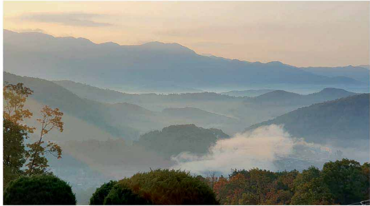
상기 이미지들은 실제 광릉추모공원과 서운동산의 촬영이미지입니다.