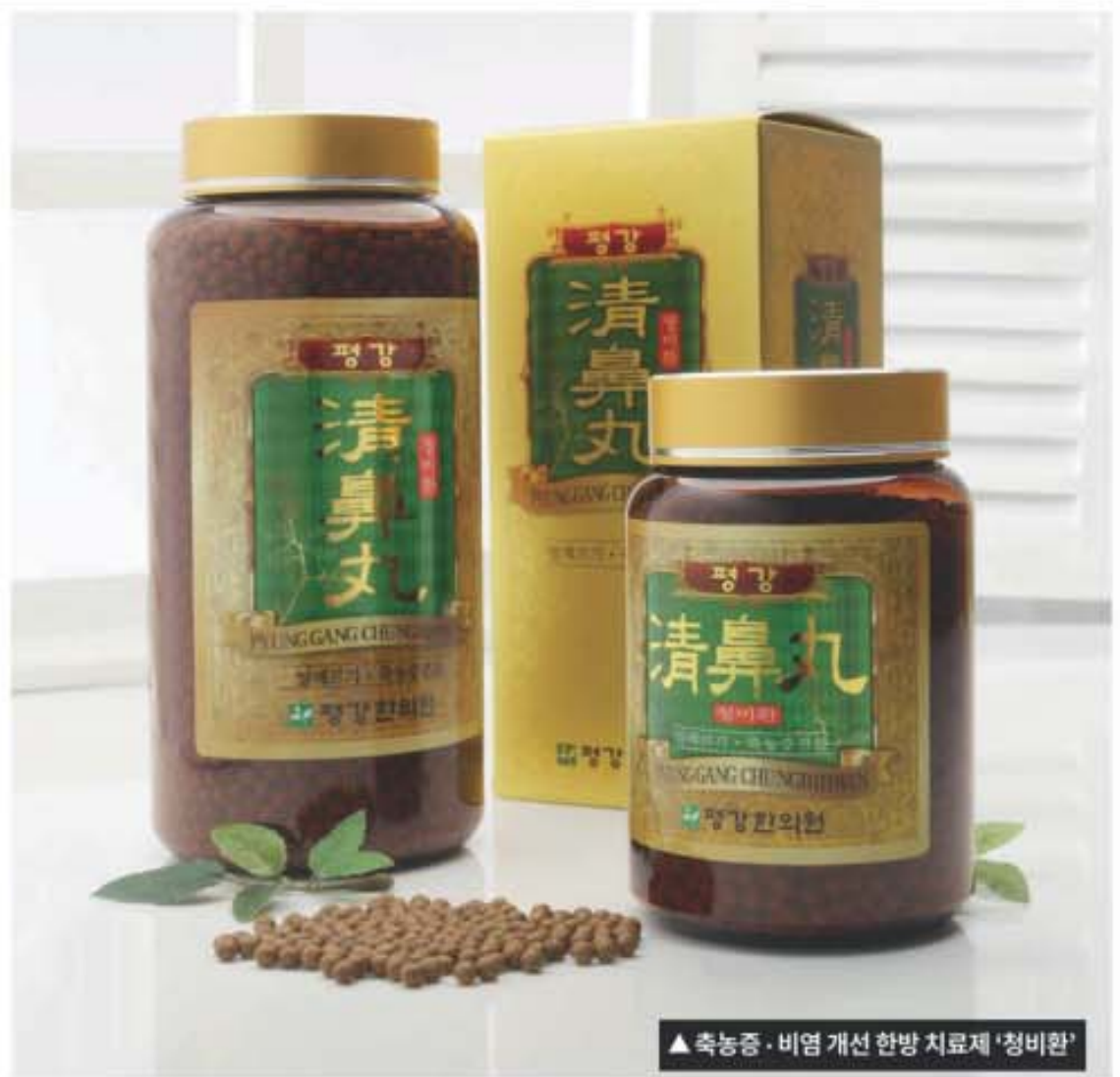
▲ 축농증·비염 개선 한방 치료제 '청비환'