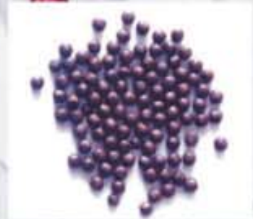
▲ 한의학박사이환용 원장이 개발한 청비환