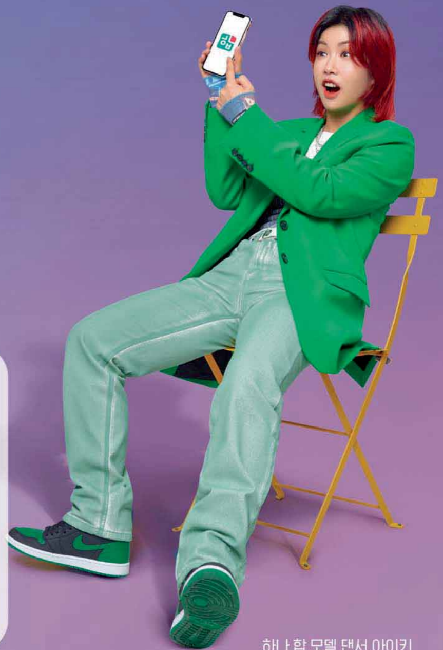
하나 합 모델 댄서 아이키