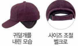
귀덮개를 내린 모습