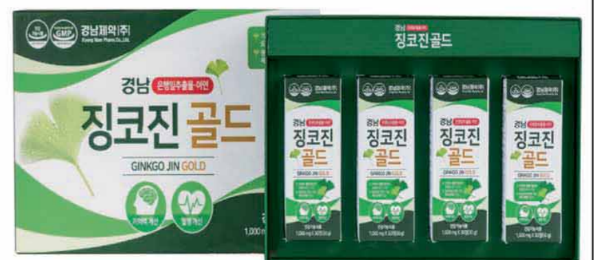
4개월분 1,000mg X 120정(30g)

오늘 주문하시는 분께 2개월분은 6일분 4개월분은 12일분을 무료로 더 보내드립니다!