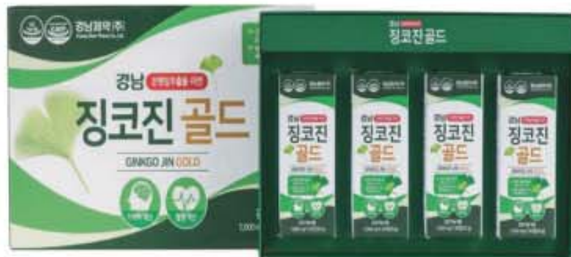
4개월분 1,000mg X 120정(30g)

오늘 주문하시는 분께 2개월분은 6일분 4개월분은 12일분 을 무료로 더 보내드립니다!