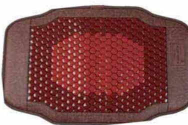
일라이트 세라믹 온열매트 75cm×46cm(±10%) 중량 2.5kg 두께 3cm

상반신 크기의 작은 사이즈로 상상 효매트의 기본 효능을 가지면서 그 중심부를 일라이트(ILLITE)로 채웠는데 특별함이 있다. 이 제품은 작은 사이즈에 이동도 편해 어디서나 사용이 가능한 데다 그 효능은 높았다는 소비자들의 인기가 높다.