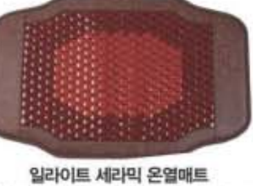
일라이트 세라믹 온열매트 75cm×46cm(±10%) 중량 2.5kg 두께 3cm

상반신 크기의 작은 사이즈로 상상 효매트의 기본 효능을 가지면서 그 중심부를 일라이트 (llite)로 채웠는데 특별함이 있다. 이 제품은 작은 사이즈에 이동도 편해 어디서나 사용이 가능한 데다 그 효능은 높였는데 소비자들의 인기가 높다.