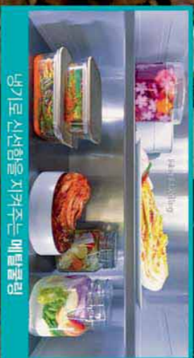
냉기로 신선함을 지켜주는 메탈클링