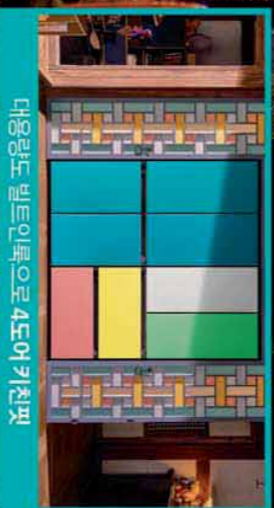
대용량도 빈틈없이 4도어 키친핏