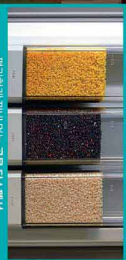
편리하게 꺼내 먹는 곡물 디스플레이

*이머시는 영동할 때 바로 신선함을 지켜줄 수 있음. *메탈클링은 영동할 때 영동할 수 있게끔 영동할 수 있음. *곡물 디스플레이는 영동할 수 있음.