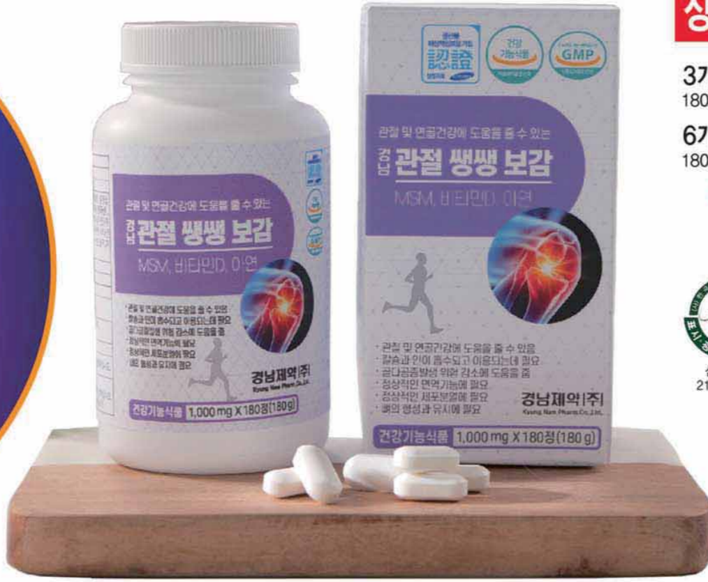
경남 관절 쌩쌩 보감

관절과 연골건강에 도움을 줄 수 있는...MSM, 비타민D, 아연 3중 복합기능성 엄선된 부원료 상어연골분말, 보스웰리아추출물분말 함유