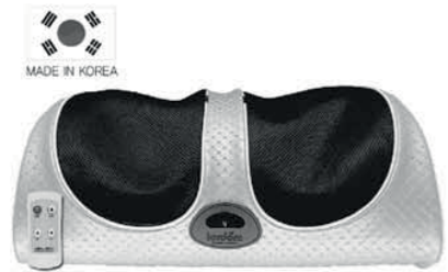
7단계 자동 발목펌프운동기(무선리모컨-고급형) [ 히트상품 선정 ]