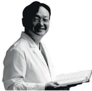
전국 서점 판매중