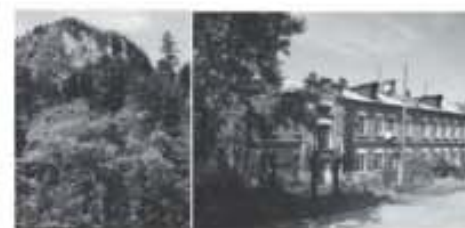
왼쪽) 북한이 주장하는 김정일 생가터. 오른쪽) 실제 생가인 러시아 연해주 라즈돌리노에 88번지.

“1983년 3월에 나온 『백과전서』까지는 백두산 밀영이 꿈의 골에 있었다고 했으니 그 이후부터 1991년까지 사이의 어느 시점에서 사령부 밀영의 위치가 국외에서 국내로 변경된 것이다. 소백수 골의 밀영의 위치는 김 주석 자신이 특정한 것이라 한다. 그리하여 거기에서 귀틀집을 짓게 하고 거기가 조선혁명의 사령부요 김정일의 생가요 하는 말을 하기 시작한 것이다. 시점이 언제인가 알아봤더니 김정일이 45세 되던 1987년 2월이었다. 아들이 어디서 났는지를 제일 잘 알 사람이 아무 거리낌 없이 온 세계를 향해 새빨간 거짓말을 마구 한다는 것은 그야말로 유일 최고의 사기극이라 아니할 수 없었다.” (p. 144)