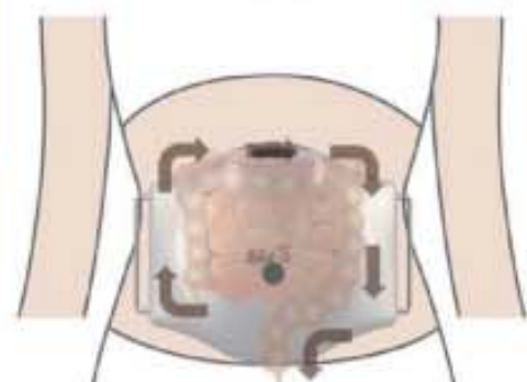
복부운동과 장운동을 동시에

인위적으로라도 배를 따뜻하게 해주고 장을 마사지하여 장의 운동을 원활하게 해주면 장때문에 발생하는 몸의 불균형을 바로 잡을 수 있다. 쉬안 복부 지압관리기는 다양한 모드의 운동방법으로 장과 복부를 지압과 마사지로 자극해장 건강과 뱃살제거 효과를 볼 수 있는 제품이다.