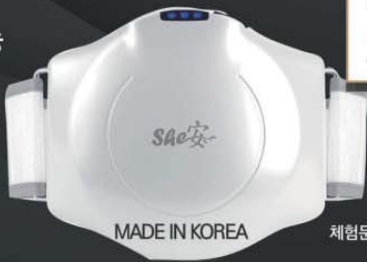
MADE IN KOREA