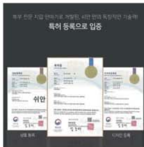
복부 전문 지압 안마기로 개발된, 쉬안 원의 독창적인 기술에 특허 등록으로 입증

남녀모두 사용이 가능하며 간편한 조작법으로 힘들지 않고 복부 마사지가 가능하다. 쉬안 복부관리기는 사람의 손가락으로 꺾꾹 누르는 형태의 복부관리기로 장의 연동 운동을 돕고 복부의 경혈 자리를 직접 눌러 지압하는 형태의 복부관리기로 국내 유일 방식의 복부관리기이다. 지압효과와 장연동운동 온열효과와 근적외선방출 기능이 포함되어 여타 다른 복부운동기에 비해 마사지효과가 훨씬 우수한 제품이다.