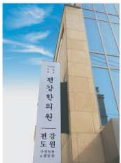
▲ 아토피·비염·천식 치료 48년 전통의 평강한의원

평강한의원 서초점은 서울 지하철 3호선 양재역 1번 출구에서 걸어서 7분 거리에 있다. 평일은 오전 9시 30분 ~ 오후 6시 30분, 토요일은 오전 9시 30분 ~ 오후 4시까지 진료하며, 일요일과 공휴일은 휴진한다. (정심시간 : 오후 1시 ~ 2시)