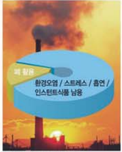
▲ 현대인의 폐 활동도

우리 몸에서 기가 중요한 이유는 기혈(氣血)관계 때문이다. 몸속을 돌아다니며 영양소를 공급하는 혈액은 혼자 힘으로 순환할 수 없어 누가 힘껏 밀어주어야 하는데 그때 필요한 힘이 바로 '기'다. 그래서 심장과 폐를 따로 말하지 않고, '심폐(心肺) 기능'이라고 한다. 심장이 혈관을 주관하고 폐가 기를 주관한다는 이치