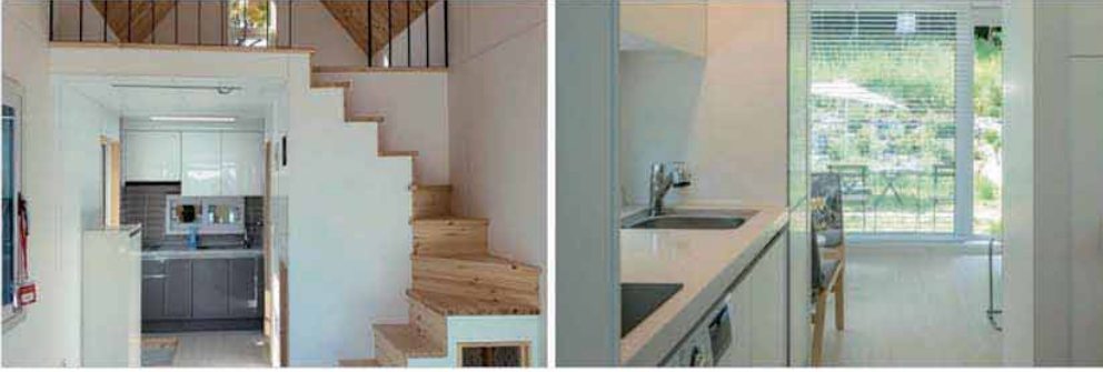
양평군 지평면 2차 단지 실제 현장