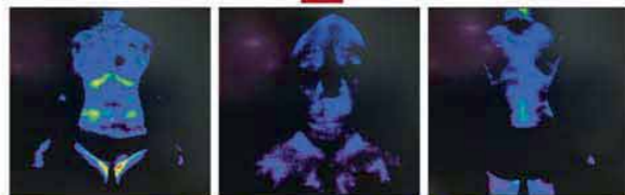
After(후) 스윙시트 사용 후

스윙시트 사용 후 목·가슴의 스트레스와 등과 허리의 경직이 호전되는 결과가 나타났습니다.