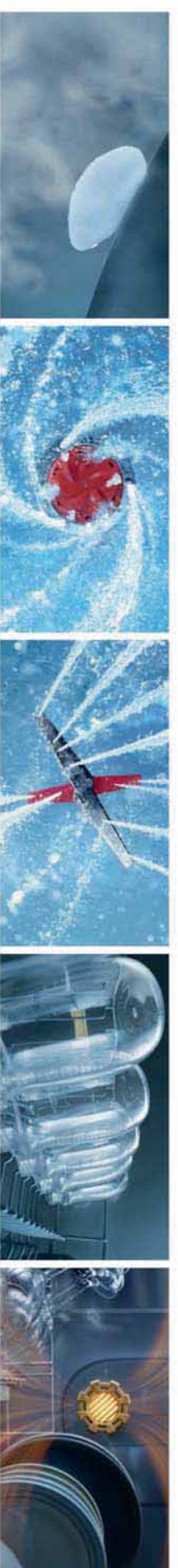
에벌 세척 필요없는 스팀 불림 집요하게 쇼이주는 360° 제트샷 구석구석 씻어주는 4단 입체물살 99.999% 살균하는 고온 좌수·궤양살균코스 남아있는 물기까지 썩! 100°C 열풍 건조